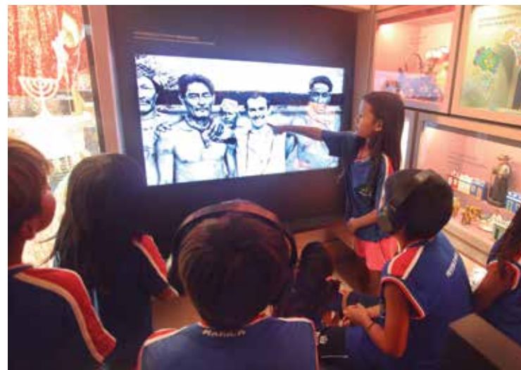
Estudantes indígenas da escola Mata Verde Bonita estiveram no local no seu primeiro dia de visita e checaram o acervo em vídeo