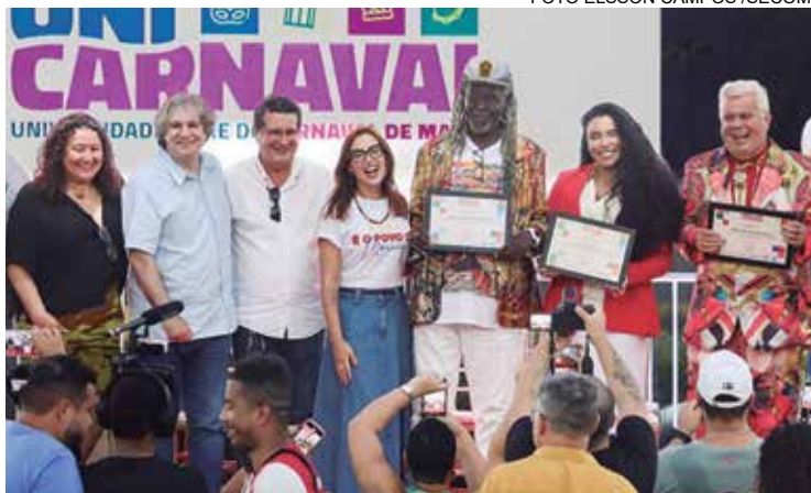
A universidade vai oferecer mais de 60 formações livres e técnicas

versidade, que vai ofertar mais de 60 formações livres, técnicas e, no futuro, cursos superiores de cenografia à produção cultural. A primeira-dama disse que a iniciativa é um grande marco da cultura e do desenvolvimento turístico de Maricá. “Para o folião, a festa dura quatro dias, mas para quem trabalha com Carnaval é o ano inteiro. São pessoas que sustentam famílias e quando a gente faz uma universidade em Maricá é para formação de profissionais nessa economia