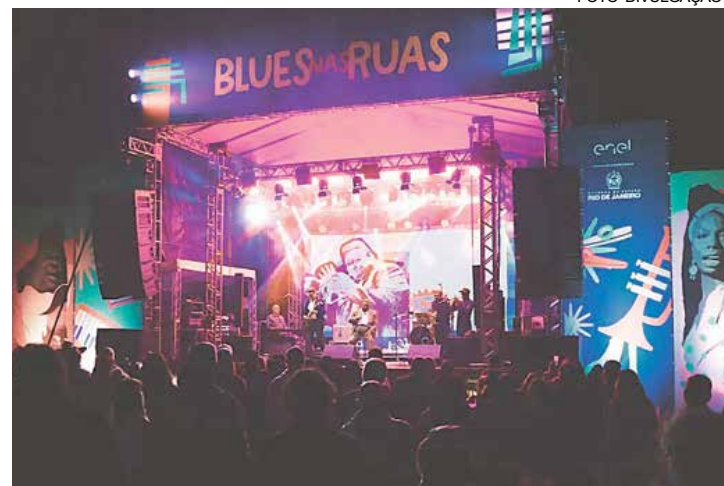
Músicos do gênero vão animar a cidade nos dias 28 e 29 de junho

Em junho, Búzios será palco do evento ‘Blues nas Ruas’, que já faz parte do calendário da cidade nos últimos anos. Nos dias 28 e 29, a partir das 19h, a cidade ficará envolvida pelo som do blues. A iniciativa cultural busca proporcionar uma experiência única para os apaixonados por música e para quem terá o primeiro contato com o gênero. Além da música, o evento visa promover entretenimento, inclusão e transformação, destacando a cultura e a educação. Evento gratuito.