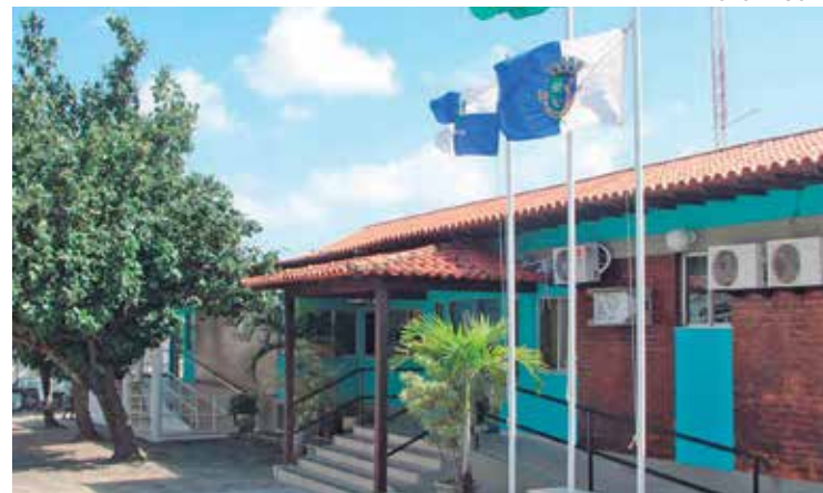
O processo de inscrição vai até o próximo dia 15 de junho

Em São Pedro da Aldeia foi aberta inscrições para o Edital de Chamamento Público nº 06/2025, lançado no dia 15 de maio, no âmbito da Política Nacional Aldir Blanc de Fomento à Cultura (PNAB). A iniciativa vai selecionar 50 agentes culturais para receber bolsas de formação e capacitação cultural. O processo de inscrição vai até o dia 15 de junho.