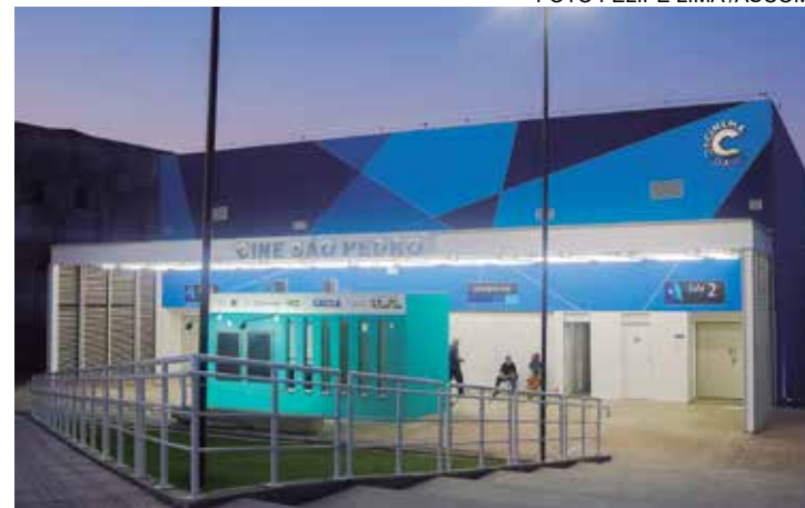
O espaço conta com sala 2D e 3D e atende aos critérios de acessibilidade, com acesso a cadeirantes e pessoas com obesidade

São Pedro da Aldeia ganhou um espaço de exibição de filmes construído por meio do programa ‘Cinema da Cidade’. Com uma sala 2D com capacidade para 96 lugares, e outra 3D, de 78 assentos, o Cine São Pedro atende aos critérios de acessibilidade, possibilitando o acesso a cadeirantes, pessoas com deficiências motoras e pessoas com obesidade. Tudo com ingressos a preços populares.