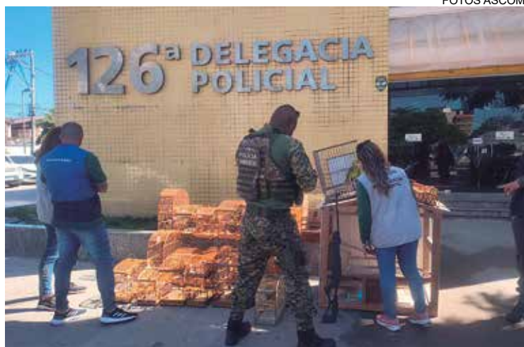
As aves encontradas foram levadas para a delegacia do município

sar chopi), Tizil (Volatinia jacarina), Trinca ferro (Saltator similis), Bico de Lacre (Estrilda astrild), Coleirinho (Sporophila caerulea) e Papagaio (amazona aestiva). O secretário de Estado do Ambiente e Sustentabilidade ressaltou a importância da ação contra o crime ambiental. "Esta operação conjunta demonstra a eficácia do trabalho integrado entre os órgãos ambientais e de segurança pública.