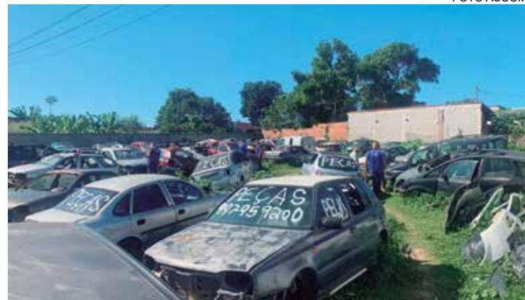
Dois ferros-velhos foram interditados em São Pedro da Aldeia

O Detran RJ realizou mais uma força-tarefa na Região dos Lagos. Dois ferros-velhos foram interditados no dia 20 de maio em São Pedro da Aldeia durante uma ação da Operação Desmonte. Agentes da Operação chegaram aos bairros de Praia Linda e Recanto das Orquídeas após informações do serviço de monitoramento do órgão do Estado e do Disque Denúncia. O presidente do órgão, Vinícius Farah, destacou a importância do cadastramento dos ferros-velhos. “É importante que esses ferros-velhos trabalhem dentro da