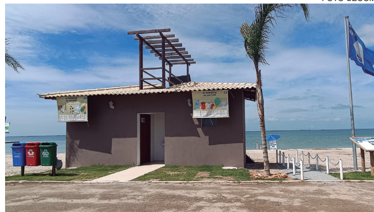
O município foi aprovado para mais um ano no programa

Mais uma vitória para São Pedro da Aldeia. O município foi aprovado para mais um ano no Programa Bandeira Azul após vitoriosa técnica realizada na Praia das Pedras de Sapitiba. A visita da coordenação nacional do selo teve como objetivo o acompanhamento das ações desenvolvidas no município e a verificação do cumprimento dos critérios exigidos pelo programa. A agenda contou com a presença da coordenadora nacional do Bandeira Azul e diretora-presi-