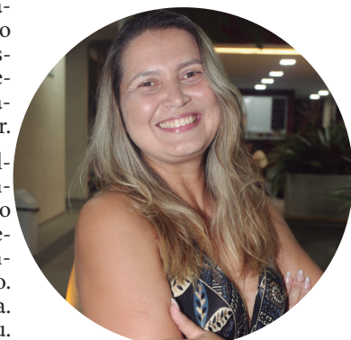
Nívea Engenharia Civil