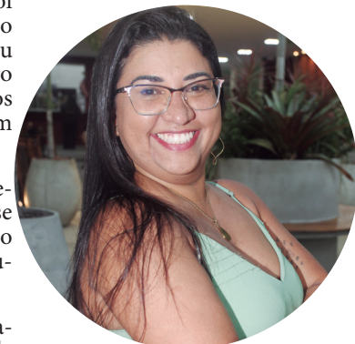
Ana Carolina Engenharia de Software