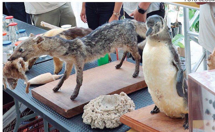
A unidade possui relevância ambiental por abrigar espécies nativas

A Área de Proteção Ambiental (APA) de Massambaba, criada em 1986 e administrada pela FEEMA, abrange 76,3 km 2 de restingas, lagoas e morros baixos. Em março, Araruama reforçou a importância da preservação ambiental na unidade de conservação localizada no distrito de Praia Seca, considerada estratégica para a manutenção da biodiversidade. Criada com o objetivo de proteger ecossistemas costeiros, a APA de Massambaba possui grande relevância ambiental por