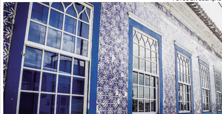
O espaço cultural é um dos pontos turísticos de São Pedro da Aldeia

Um dos principais patrimônios históricos de São Pedro da Aldeia, a Casa dos Azulejos vai ganhar novos horários de visitação. Com a alteração, o espaço cultural estará aberto ao público de segunda a sexta-feira, das 9h às 12h e das 13h30 às 17h. O objetivo da adequação é oferecer melhor atendimento aos visitantes e organizar o fluxo de público que procura o local ao longo da semana.