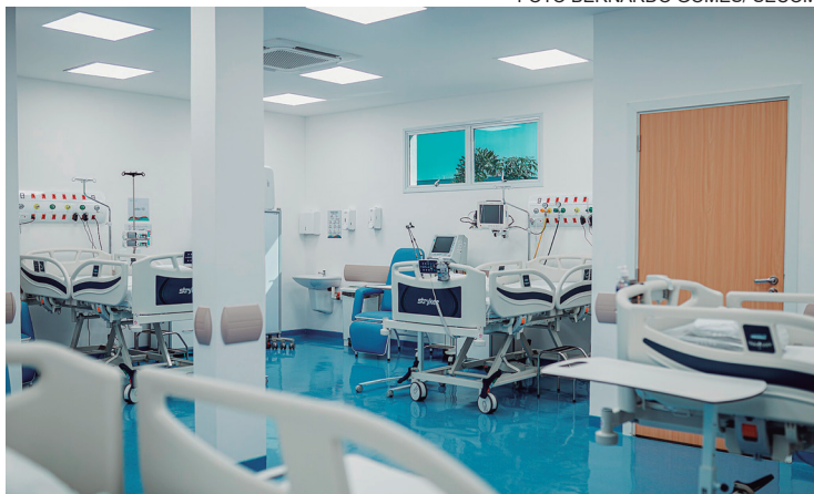
A unidade de saúde ganhou 17 novos leitos de enfermaria