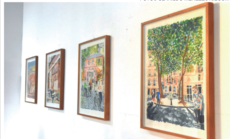
Exposição de artista francês na Casa de Cultura, em Maricá

A Casa de Cultura de Maricá, no Centro, recebe até 18 de abril a exposição ‘Villes et Cores’, do artista francês Jérôme Poignard. Iniciada no dia 20 de março, a mostra reúne 21 obras em aquarela sobre acrílico, retratando cidades como Rio de Janeiro, Paris e Nova York sob uma perspectiva artística contemporânea.