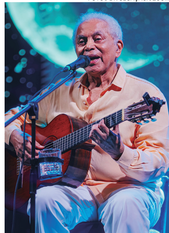
Ludmilla e Paulinho da Viola foram alguns dos músicos que se apresentaram na cidade