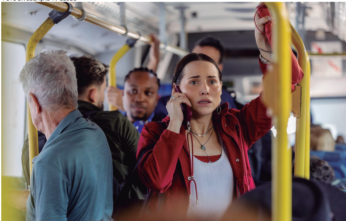
Letícia Colin interpreta Adriana, mocinha que vai do céu ao inferno após morte na novela