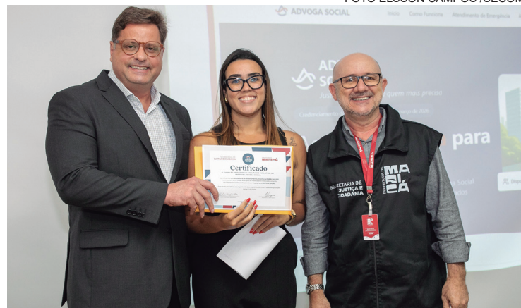
A iniciativa vai oferecer assistência jurídica gratuita

A Secretária de Justiça e Cidadania de Maricá, em parceria com a OAB-RJ e a OAB Maricá, assinou o termo de adesão dos 98 advogados selecionados para atuar no programa Advoga Social na Universidade de Vassouras. A iniciativa oferece orientação e assistência jurídica digital gratuita para moradores do município contribuindo para reduzir a sobrecarga da Defensoria Pública. O atendimento é realizado de forma totalmente online, por