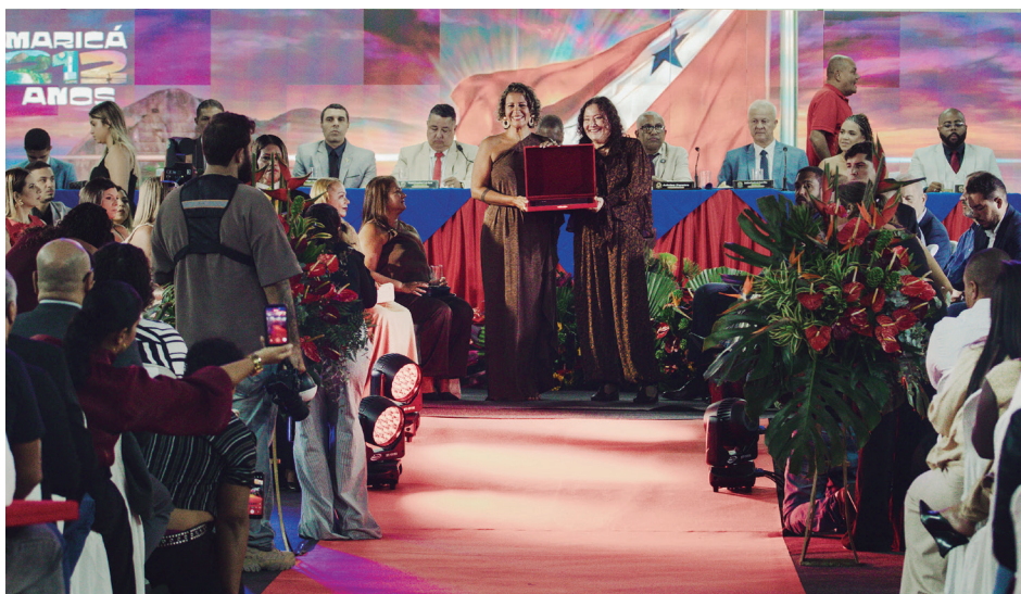
Uma Sessão Solene foi organizada pela Câmara Municipal