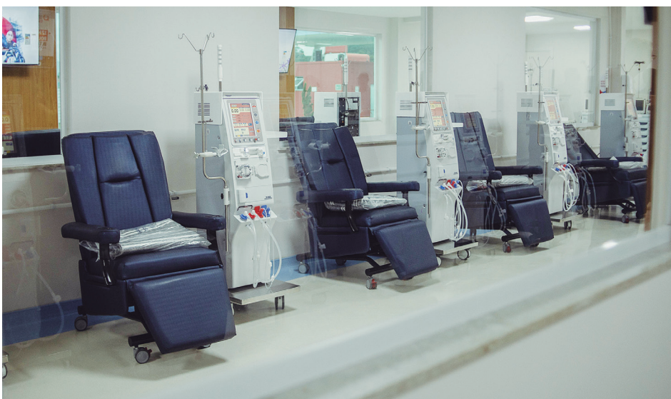
Um Centro de Hemodiálise no Hospital Municipal Dr. Ernesto Che Guevara fez parte da agenda de comemoração